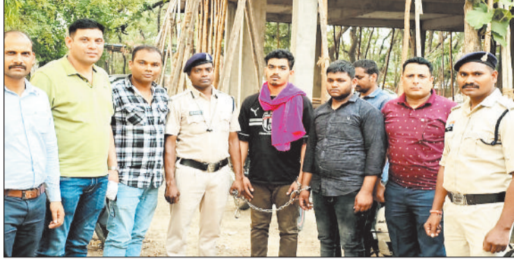
साइबर टीम की गिरफ्त में तस्कर।

लैलूंगा पुलिस और साइबर सेल की संयुक्त टीम ने गांजा तस्करों के खिलाफ बड़ी कार्रवाई की है। टीम द्वारा ओडिशा से गांजा लाकर शहर में बेचने वाले दो बड़े गिराहों के दो तस्करों को दबोचा गया है। आरोपियों के पास से 61 किलो गांजा, तीन कार, सात मोबाइल, नकदी 1.80 लाख सहित कुल 46 लाख 36 हजार रूपय की संपत्ति जब्त की गई है। वहीं दोनों आरोपियों को एनडीपीएस एक्ट के तहत गिरफ्तार कर न्यायिक रिमांड पर जेल भेज दिया गया है।