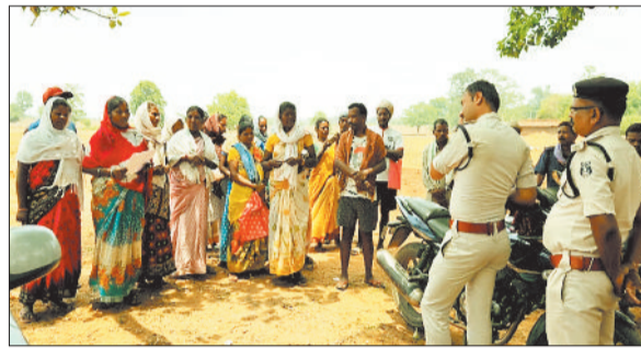
विवाद स्थल पर ग्रामीणों को समझाइश देते पुलिस।

लोकन निर्माण कार्य शुरू होते ही कुछ असामाजिक तत्वों ने निर्माणधीन ढांचे में तोड़फोड़ कर दी। घटना के बाद क्षेत्र में तनाव का माहौल बन गया। स्थिति की गंभीरता को देखते हुए प्रशासन ने तत्काल कार्रवाई करते हुए तहसीलदार, राजस्व विभाग की टीम और पुलिस बल को मौके पर भेजा। मौके पर पहुंचे अधिकारियों ने हालात का जायजा लिया और स्थानीय लोगों से बातचीत की। पुलिस ने मौके पर उपद्रव करने वालों की पहचान कर कार्रवाई शुरू कर दी है। इस मुद्दे पर स्थानीय लोगों में मतभेद देखने को मिल रहा है। एक ओर अधिकांश ग्रामीण इस परियोजना को क्षेत्र के विकास से जोड़कर देख रहे हैं और