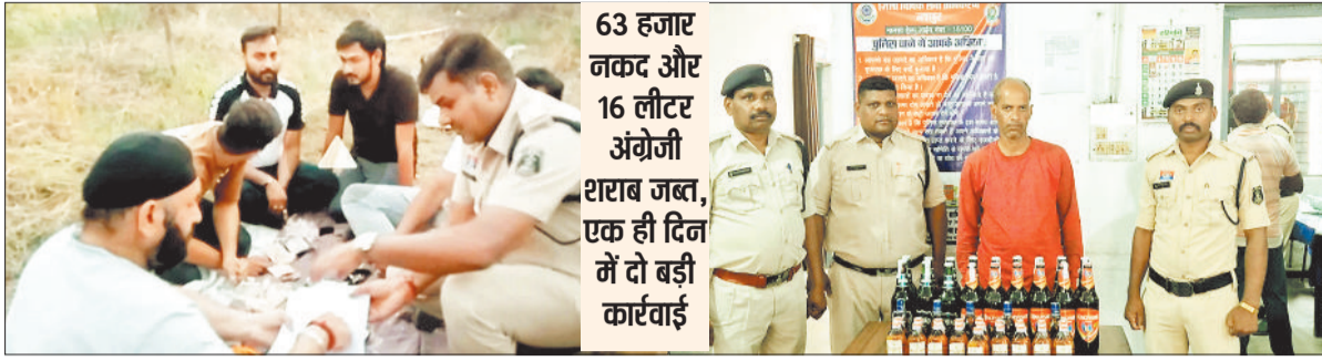
मौके पर जुआरियों को खिलाफ कार्रवाई करती पुलिस।

जिले के पस्थलगांव थाना क्षेत्र में सोमवार को पुलिस एक्शन मोड में नजर आई। दो अलग-अलग मामलों में जुआ और अवैध शराब के खिलाफ की गई कार्रवाइयों ने स्थानीय लोगों को चौंका दिया। प ह ली कार्रवाई में जहां निर्माणधीन मकान के पीछे जुआ खेलते 5 युवकों को गिरफ्तार किया गया, वहीं दूसरी कार्रवाई में अंग्रेजी शराब लेकर जा रहे एक युवक को बाइक सहित पकड़ा गया।