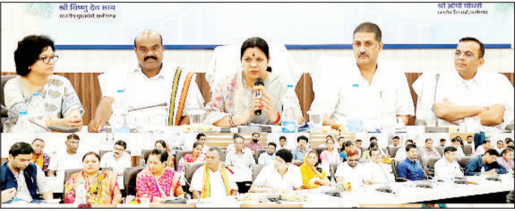
अधिकारियों कर्मचारियों की बैठक लेते अफसर।

जिला पंचायत जांजगीर-चांपा के सभाकक्ष में रजिस्ट्री की दस नई क्रांतियों पर एक दिवसीय कार्यशाला का आयोजन किया गया। कार्यशाला में मास्टर ट्रेनर्स और अफसरों ने विस्तार से जानकारी देते हुए बताया कि अब रजिस्ट्री के साथ नामांतरण की प्रक्रिया स्वतः होगी। इसके लिए अब कोई अलग से प्रक्रिया नहीं करनी पड़ेगी।